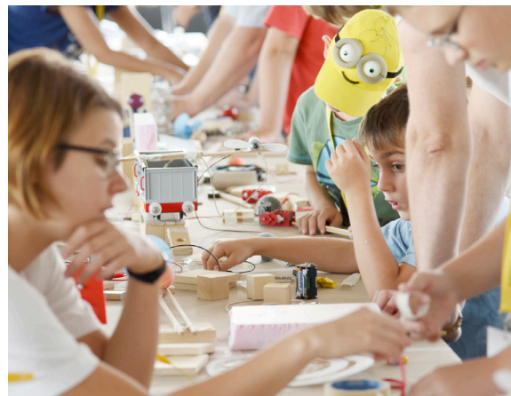
Abb. 3: Kettenreaktionsmaschine