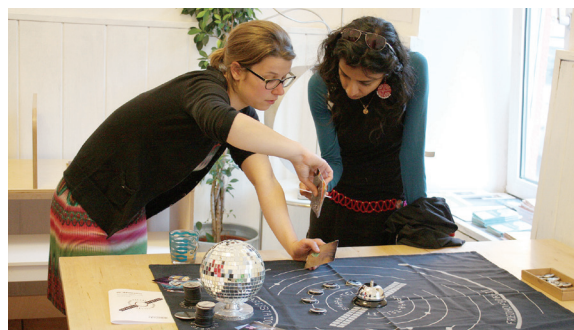
Abb. 2: Diskussionsspiel