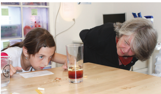
Abb. 1: Hands-on Experiment